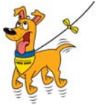
pup in training

Dus voor beide hondenbezitters geldt: Houd voldoende afstand, zodat u elkaar kunt ontwijken.